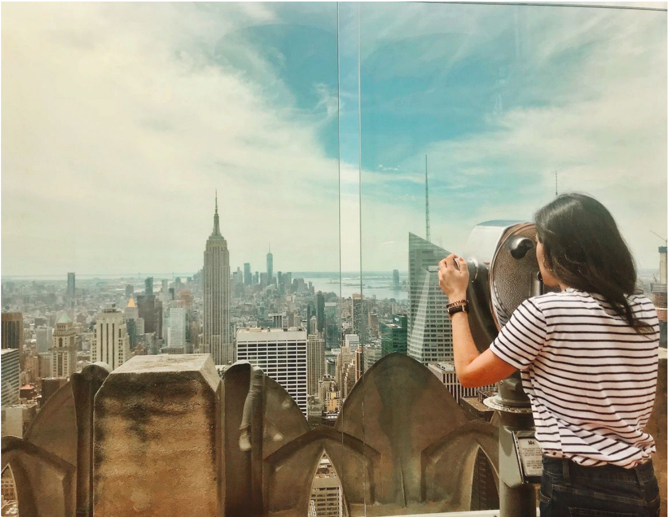
Vistas desde el Top of the Rock (Nueva York)