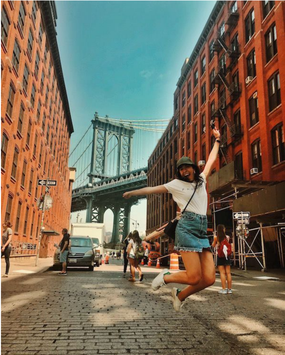
Fulton St. (DUMBO) – Nueva York

Las lista de consejos que facilito a continuación se basan en la experiencia de haber estado tres veces en Nueva York: una muy poquitos días en la que pude verlo todo pero sin tiempo para pararme a disfrutar de las cosas; la segunda, en la que pude pasar una semana entera en la ciudad y hacer todas aquellas cosas que tenía pendientes, y la tercera en la que pude volver a mis sitios preferidos y conocer otros nuevos.