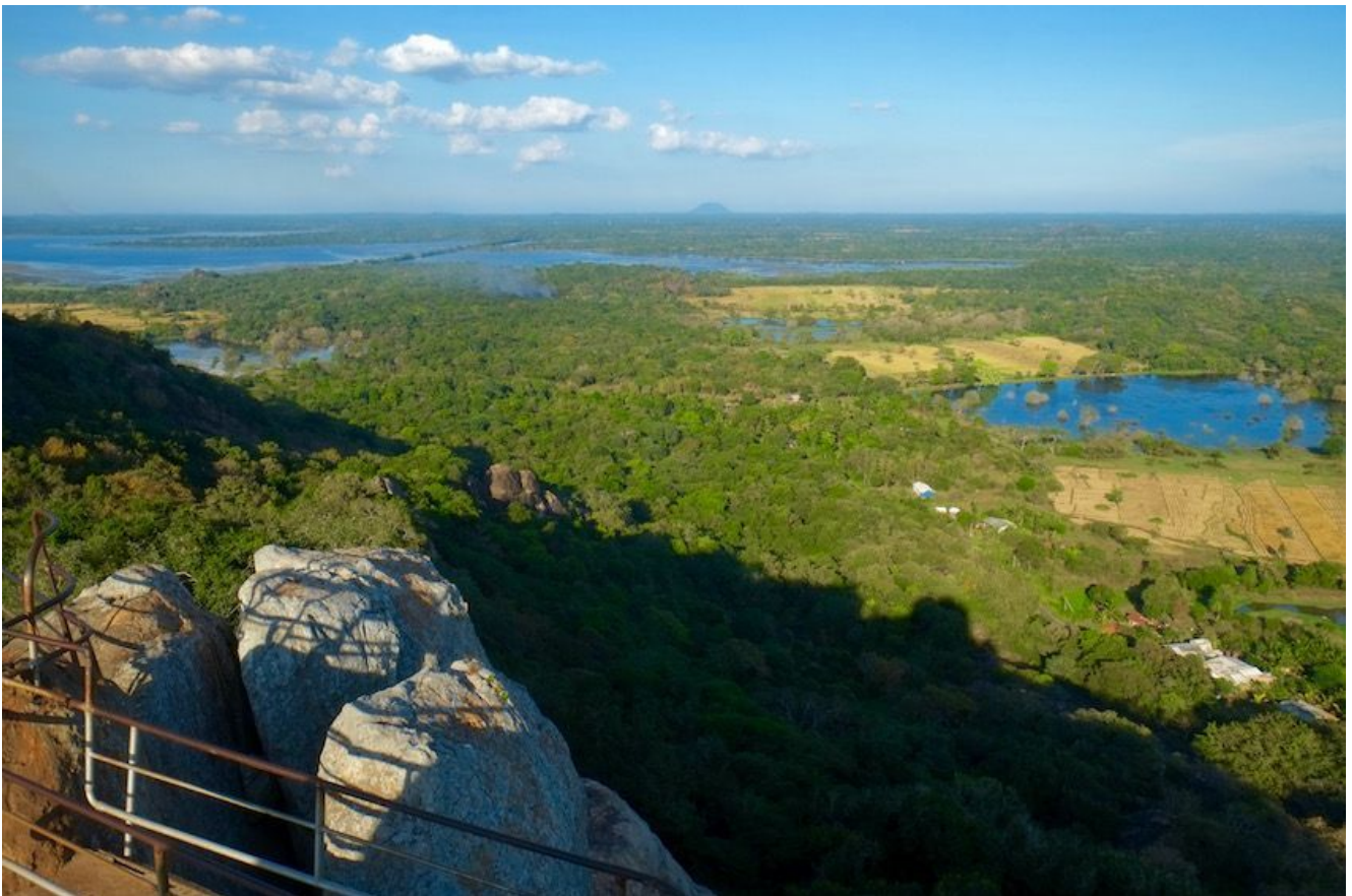
Vistas desde Mihintale -Sri Lanka