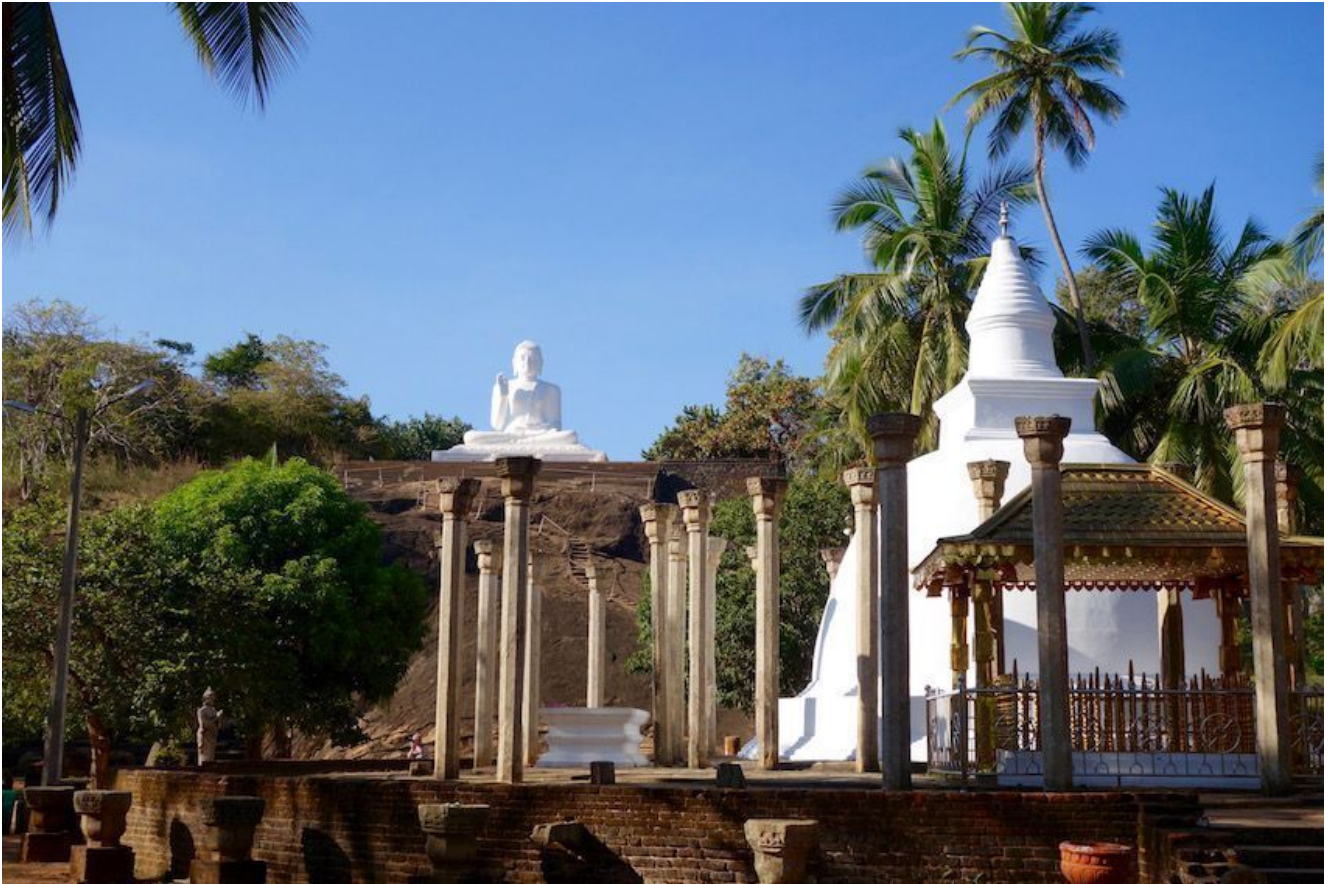
Dagoba Ambasthala y estatua de Buda