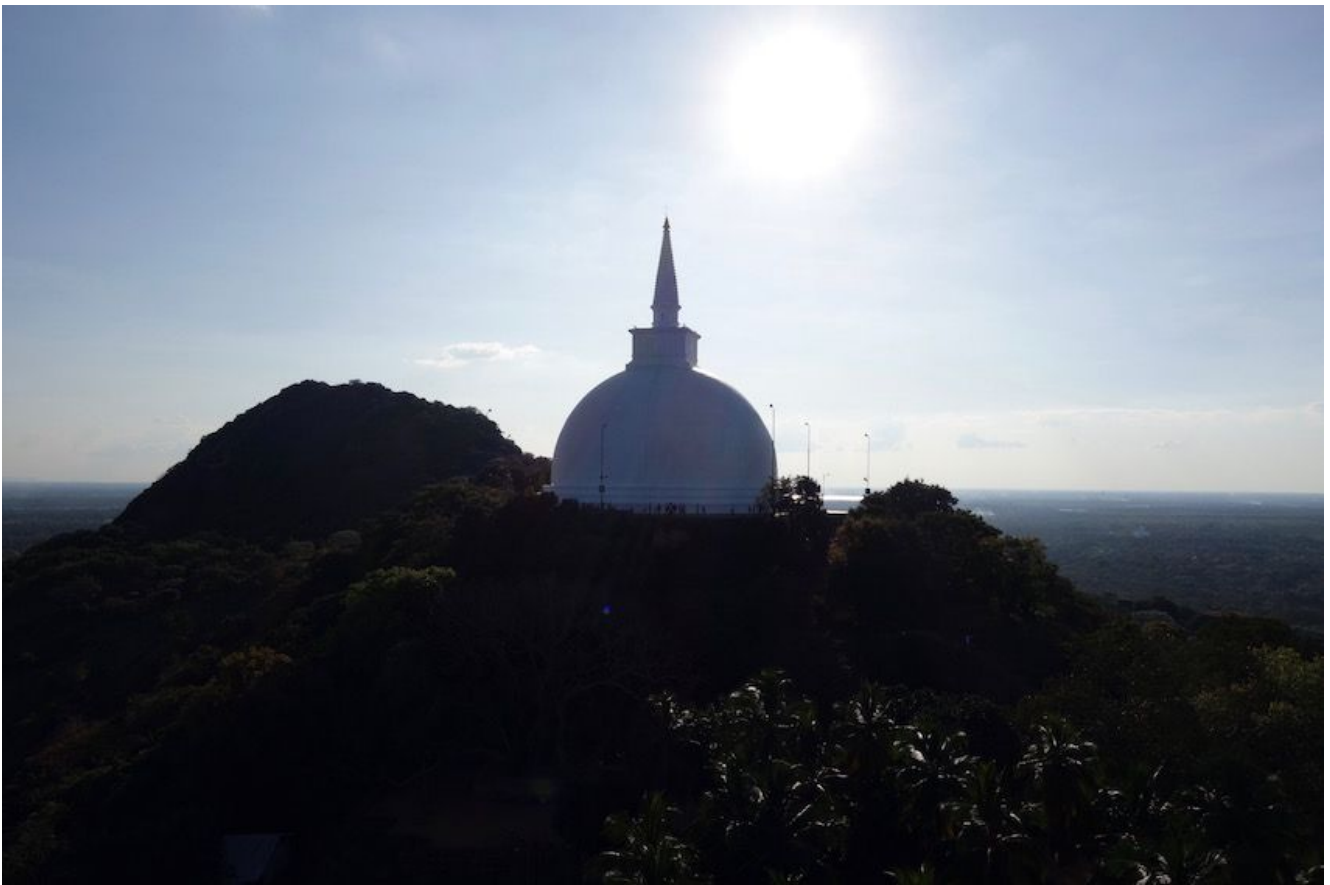
Dagoba Maha (Mihintale)

Mihintale es un pico montañoso localizado a escasos kilómetros de la ciudad antigua de Anuradhapura conocido por ser considerado el lugar donde se introdujo el budismo en Sri Lanka . Se encuentra en una zona montañosa de 1000 metros de altura y consiste en un amplio recinto donde además de subir a la roca se pueden visitar varios enclaves: las ruinas de un hospital, la dagoba Maha (espectacular, en la cima de la colina), la dagoba Ambasthala (a los pies de la roca) y una escultura de Buda.