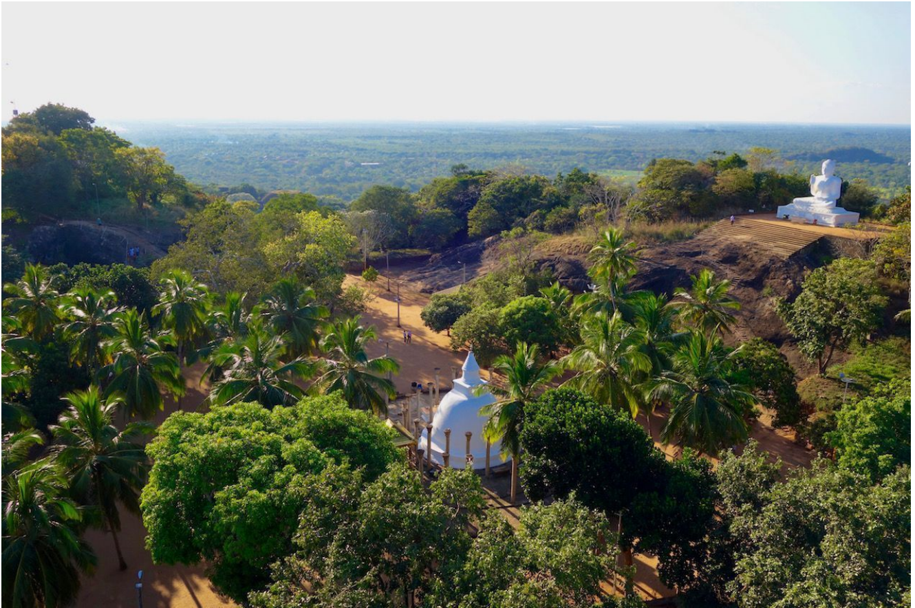
Vistas en Mihintale – Sri Lanka